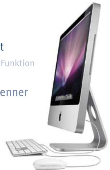
Foto- & Filmsoftware iPhoto & iMovie